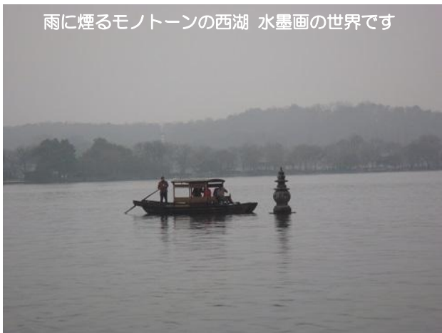
雨に煙るモノトーンの西湖 水墨画の世界です