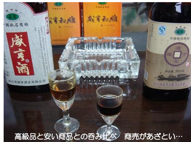
高級品と安い商品との呑み比べ 商売があざとい…