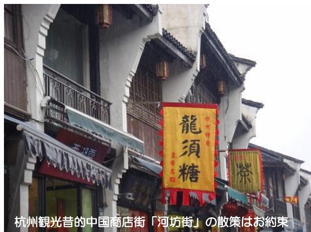
杭州観光昔の中国商店街「河坊街」の散策はお約束