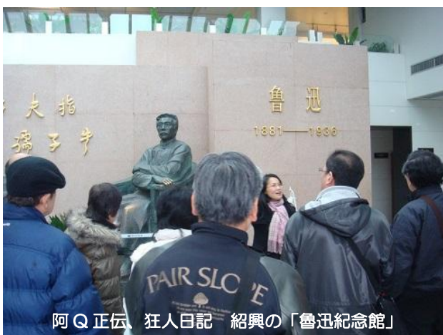
阿Q正伝、狂人日記 紹興の「魯迅紀念館」