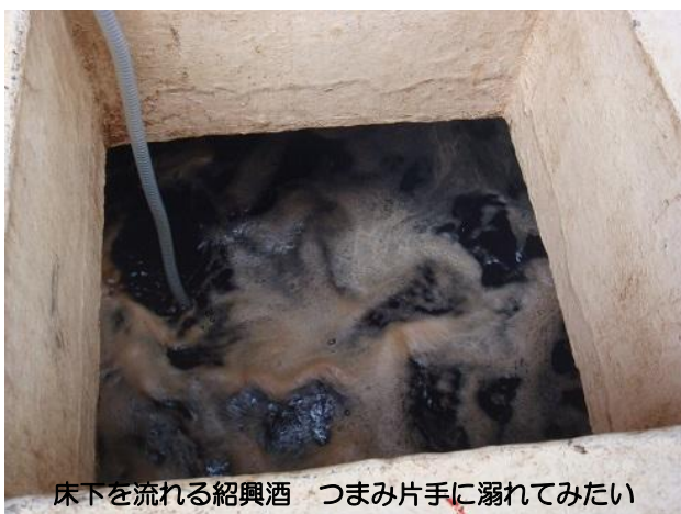
床下を流れる紹興酒 つまみ片手に溺れてみたい