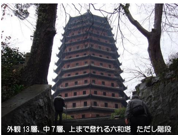
外観 13層、中 7層、上まで登れる六和塔 ただし階段